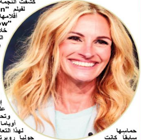
حماسها سابقا كانت الاجتماعي بعد

جوليا روبرتس قد تصدرت تريندات منصات التواصل صدمتها للمدرب الإسباني جوزيب غوارديولا، مدرب مانشستر سيتي بحضورها مباراة في ملعب غريمه مانشستر يونايتد في عام 2016. قال غوارديولا إن مشواره مع النادي الإنجليزي سيكون فاشلا حتى لو أحرز لقب دوري أبطال أوروبا 3 مرات، طالما أن جوليا روبرتس حضرت مباراة في ملعب غريمه. وأضاف قائلا: "لدي 3 قذوات في حياتي، أسطورة كرة السلة الأميركي، مايكل جوردان، نجم الغولف الأميركي تايجر وودز، نجمة هوليوود جوليا روبرتس".