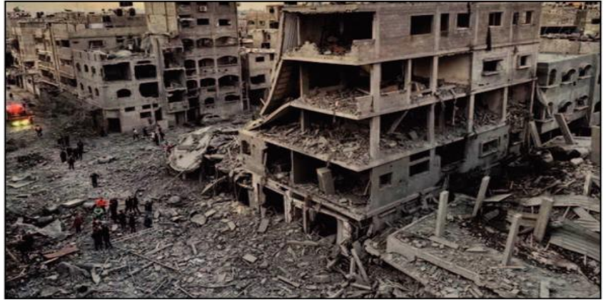
ف. س. ق. و.

استهل الكيان الصهيوني اليوم الـ 59 من حربه على قطاع غزة بقصف مستشفى كمال عدوان، شمالي القطاع، ما أوقع عشرات الشهداء والجرحى، كما صعد الاحتلال وتيرة استهداف المنازل المأهولة في مناطق متفرقة، بينما تجري اشتباكات عنيفة في أكثر من محور.