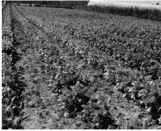
في هذا الإطار، ذكر السيد شرفة بتوجيهات رئيس الجمهورية، التي أسداها خلال الجلسات الوطنية للفلاحة التي نظمت في 28 فبراير 2023، الخاصة بوضع نظام تحفيزي للمنتجين الذين يتبعون نمط إنتاج يسمح بتحقيق محصولين في سنة واحدة، وتمويل المشاريع الفلاحية المهيكلية بنسبة 90 بالمائة من تكلفة المشروع من طرف البنوك. كما ذكر بالمزايا التي تضمنها قانون الاستثمار الجديد، وكذا إعادة النظر في القوانين التي توطر جوانب مهمة في قطاع الفلاحة، وضع إطار لمنح اعتماد مكاتب الدراسات الخاصة بالفلاحة، استكمال عملية تطوير العقار الفلاحي، تعديل النص القانوني المتعلق بإنشاء التعاونيات الفلاحية، وكذا الترخيص باستيراد العتاد الفلاحي المجدد وغيرها من الإجراءات التحفيزية.

الذي تنظمه وزارة الفلاحة تحت الرعاية السامية لرئيس الجمهورية، السيد عبد المجيد تبون، بحضور أعضاء من الحكومة، ولاة من الولايات الجنوبية، وكذا منظمات أرباب العمل، الفلاحين والمهنيين. وأوضح السيد شرفة أن الأقطاب الكبرى المدمجة، تنطلق من الإنتاج الفلاحي مرورا بالتحويل، التوضيب والنقل ووصولاً إلى المنتج النهائي، وذلك عبر تطوير الصناعات التحويلية وتموينها بمدخلات فلاحة ذات منتج وطني، وأذكر خاصة، إنتاج الزيوت، السكر، مسحوق الحليب، الحبوب والبقول الجافة والقطن الموجه للصناعات النسيجية". ولفت إلى أن هذه "النظرة الجديدة"، ستسمح بكسب معركة الأمن الغذائي، وذلك عبر تطوير هذه الأقطاب الفلاحية الكبرى التي أكد أنها موجهة لضمان تغطية الاحتياجات الوطنية وتصدير الفائض. وتعمل وزارة الفلاحة على هذه المشاريع الاستراتيجية لتحقيق "وثبة حقيقية" في الإنتاج والتحويل للوصول إلى تشكيل أقطاب فلاحة مدمجة "التي ستخلق ديناميكية في التنمية الاقتصادية والاجتماعية وتعزيز الأمن الغذائي"، يضيف السيد شرفة. ودعا الوزير المستثمرين من داخل وخارج البلاد إلى "الانخراط بقوة" ضمن مسعى الاستثمار الفلاحي في الجنوب، لافتاً أنه "سيتم تخصيص لهم رواق أخضر، سواء للحصول على العقار أو التسهيلات الأخرى الخاصة بحضر الأبار والطاقة الكهربائية".