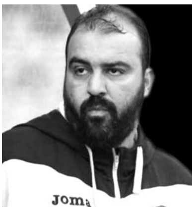
صعوبات كبيرة لتأهيل لاعبيه الذين اتدبتهم خلال فترة التحويلات الصيفية وعددهم ثمانية بسبب الحظر المفروض

الموسم الجاري، وذلك أمام اتحاد خنشلة (0-1) في الجولة السادسة.