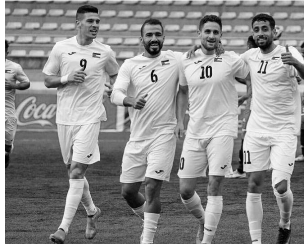
المسابقة التي ستشهد على 6 مجموعات. وسيقم مشاركة 24 منتخبا موزعين منتخب الفدائي تربيصه في