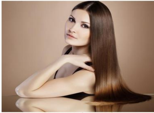
عدم الإفراط في غسل الشعر

قد يظن البعض أن كثرة غسل الشعر أمر جيد، حيث يساعد على التخلص من العرق، الدهون الزائدة والأتربة العالقة. لكن هذا أمر خاطئ، فحتى بالنسبة للشعر الدهني، لا ينبغي غسله لأكثر من 3-4 مرات خلال الإسيوع، أما في حالة الشعر الجاف، فتكفي مرتين فقط، لذلك كما في جسدنا للتخلص من الأتربة والشوائب العالقة بالشعر، لا تقومي بغسل شعرك باستخدام الشامبو بشكل يومي، فقد يؤدي ذلك لإزالة العناصر الطبيعية اللازمة للشعر.