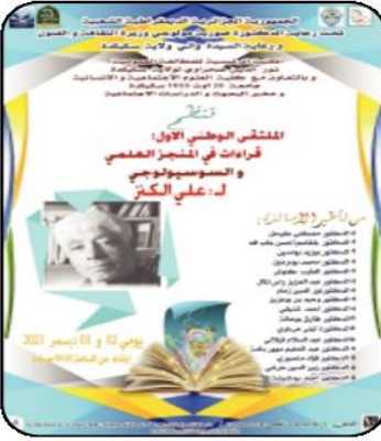
تكريس ثقافة الاعتراف بأعلام الثقافة الوطنية

تواصل لليوم الثاني بقاعة المحاضرات الكبرى للمكتبة الرئيسية للمطالعة العمومية لولاية سكيكدة نور الدين صحراوي فعاليات الملتقى الوطني الأول الموسوم بـ "قراءات في المنجز العلمي والسوسيوولوجي لعلي الكنز".