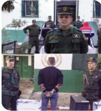
مقابل مبلغ مالي، وهذا بعد أن قام أفراد الفرقة باستيعاب كامل تحركاته ومراقبته ثم ترصده متلبسا بالجرم.

بعد توقيفه على متن مركبة وتفتيشه على متن بحوزته على ملفات ووثائق صادرة من مختلف الشركات والأوساط وخاصة مثل شهادة كشف الراتب، شهادة الانتساب للصندوق الوطني للتأمينات الاجتماعية للعمال، شهادة كشف الراتب لبنوك مختلفة وغيرهما من الأوراق التي اتضح فيما بعد أنها مزورة كما أن الملف هو لشاهدة أحد الأشخاص لقصد تسهيل الحصول على التأشيرة للتوجه نحو أوروبا مقابل مبلغ مالي مقدّر بـ 1200000 دج. وسيتم تقديم العنصر أمام الجهات القضائية المختصة لإقليميا بعد استكمال كامل الإجراءات.