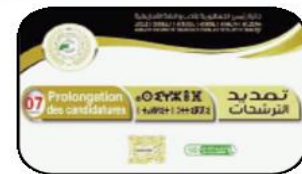
أعلنت المحافظة السامية للأمازيغية عن تمديد فترة الترشيحات لجائزة رئيس

الجمهورية للأدب واللغة الأمازيغية في طبعتها الرابعة إلى غاية 7 ديسمبر 2023 كآخر أجل لاستقبال الأعمال المشاركة. تم الاعلان عن تمديد الفترة في بيان للمحافظة السامية للأمازيغية يقول "تعلن المحافظة السامية للأمازيغية عن تمديد فترة الترشيحات لجائزة رئيس الجمهورية للأدب واللغة الأمازيغية في طبعتها الرابعة من 01 إلى 07 ديسمبر 2023 كآخر أجل لاستقبال الأعمال المشاركة". وعليه، يضيف ذات المصدر -سوف يتم غلق