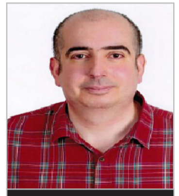
بقلم حسين علي غالب

لقد كان الجيش الأمريكي المدجج بشتى الأسلحة المتطورة، ومحصن بقواعد عسكرية عملاقة بعيدة عن الأنظار، يصدر بيانات بشكل يومي ومكثف، كيف هو منتصر ولا يوجد من يقف بوجهه فهو "الجيش الذي لا يقهر" وجاء من