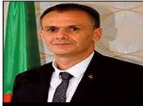
الوزير حماد يعزي في وفاة رئيس محكمة التحكيم الرياضي

أول يومية وطنية إخبارية تربوية شاملة ، تهتم بكل الفئات وكل الرياضات.