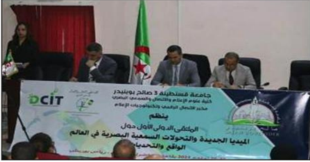
ذات اللقاء التطرق لمواضيع استغلال الذكاء الاصطناعي ومهيجات البحث عبر وسائل الإعلام الجديدة من طرف أساتذة وباحثين ومتخصصين قدموا من جامعات عدة دول. للإشارة، يشارك في هذا الحدث الذي يدوم يومين متخصصون من الجزائر وتونس والأردن ومصر ولبنان.

أكد مشاركون في أشغال الملتقى الدولي الأول حول « وسائل الإعلام الجديدة والتحولت السمعية البصرية في العالم: واقع وتحديات » الذي افتتح أمس الأول بكلية الإعلام والاتصال والسمعي البصري بجامعة صالح بوبنيدر (قسنطينة 3) على ضرورة توجيه الأبحاث العلمية نحو وسائل الإعلام الجديدة لضمان تنمية إجتماعية وإقتصادية للبلاد.