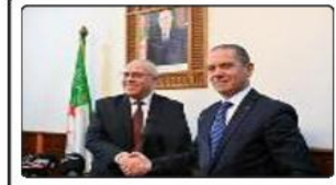
شرفه يتسلم مهامه على رأس وزارة الفلاحة والتنمية الرياضية

يومية إخبارية عامة ■ www.chebabdjazairi.com ■ الخميس 30 نوفمبر 2023 الموافق لـ 15 جمادى الأولى 1445 العدد 3247 ■ الثمن: 10 دج