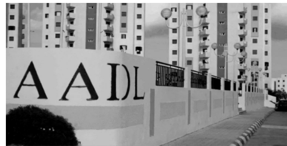
المكتب. وحسب بلعربي فإن العمل جار على تحيين المرسوم التنفيذي الخاص بسكنات

وكان رئيس الجمهورية أعلن نهاية أكتوبر عن إطلاق برنامج ثالث لسكنات البيع بالإيجار "عدل 3" في غضون العام المقبل.