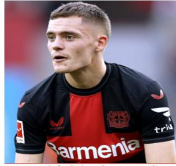
تشابي أونسو، حالياً، والذي يقدم مستوى كبيراً في جميع المسابقات لكوسم، ووضع نادي بايرن ميونخ، لأصعب خطأ لوسط،

فلوريان فيرتز، على قائمة الميركاتو كوسم جديدة عن اقترب نادي بايرن ميونخ من حطفت نجم جديد من "البوندسليغا" يُعتبر اليوم من أبرز نجوم بطولة الدوري، والذي يمكن أن يلعب دوراً كبيراً في تطوير مستوى النادي "البافاري". ووفقاً للمعلومات التي نشرها "سكاي سبورتس ألمانيا"، فإن نادي بايرن ميونخ الألماني وضع على راداره نجم فريق باير ليفركوزن، فلوريان فيرتز، الذي يُعتبر من أبرز نجوم تشكيلة المدرب،