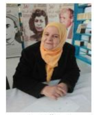
عندما تتعاصرتي الوحشة

أشتهي متانمة البوح في الداد المهوس بالاضياء أصب سلاماً معتقاً أهدية للقيمة العابرة أوصيها أن تسقي الوردة البرية تلك التي تعانق وجع الفترتين بين الأحياء.