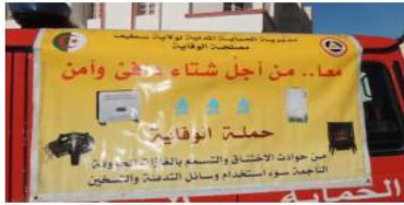
بالعام الماضي 2022 الذي شهد وفاة 13 ضحية وإتقاد 142 مصاب في 61 حادث.