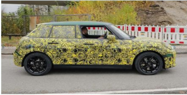
والتي نتوقع أن توضح عنها الشركة خلال الأسابيع المقبلة. احتراق داخلي، بينما ستضيف للأصدار ذو الثلاثة أبواب نسخة كهربائية.

التي حصل عليها الموديل الجديد مقارنة بالتحالي، وأبرزها الشبكة والمصد الأمامي الجديدين، والتصميم المحدث للمصابيح الخلفية، حيث أن هذا الإصدار يشبه إلى حد كبير النسخة الكهربائية الجديدة ذات الثلاثة أبواب، ولكن تأتي بدعامة B أكثر سمكا، ومقابض أبواب تقليدية بدلا من الموجودة لدى شقيقتها الصغرى.