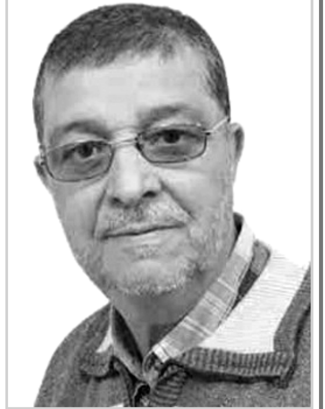
بقلم قرار المسعود

بدون منازع، أي صمود و غزة و هب هذا يا أهل غزة صانعة الأجداد أثناء الهدنة الإنسانية، إنكم صنعتم وعرفتم البطولة وحب الوطن في الملحمة الأسطورية لطوفان الأقصى، يا شعب الجبارين كشفتم للعالم معنى الإنسانية في صورتها الحقيقية ودرستم للمسلمين معنى الصبر والتوكل على الله وحده وأظهرتم للسامية هزيمة سياسية من المسافة الصفر. وفي الوجه الآخر كشفتم صورا من الخذلان ومن ذل لمن طبع وهزل ومسد وخان الله ورسوله هؤلاء الذين أرادوا أن يحى شعب فلسطين فأصبح كل العالم فلسطين. اللهم تكون هدنة كصلح الحديبية يعقبها كفتح بيت المقدس وتحرر العالم من الماسونية التي تسير من وراء الستار وصحوة الشعوب المقهورة عبر العمورة وتفكك القطبية الأحادية.