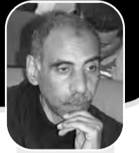
يقلم: على شكشك

ليس مجرد قمع، وليس مجرد أسر، وليس مجرد عذاب هذا الذي يعترض له الفلسطيني، هناك حالة خاصة به. حالة تتفقد إلى نظير سابق لها في التاريخ بل في المستقبل، حالة خاصة تتغلغل في كل مفردات الحديث عنه، وحتى عندما نتحدث عن جغرافيته نجدنا بتلقائية مضطرين إلى التوكيد والتفصيل لنقول: الفلسطيني أينما كان في الوطن المحتل عام ثمانية وأربعين أو الجزء المحتل عام سبعة وستين ونظراً لأهمية القدس والمواثيق التي تحاك فيها وعليها فلا بد من ذكرها مع التشديد، كأن هاجساً يحذرنا من إغفالها فينفضوا عليها كما فعلوا عندما نسينا آل التعريف في قرار اثنين أربعة اثنين وما زلنا نعاني من ذلك النسيان، دون أن ننسى أيضاً مختلف أشتات الشتات، والافتقار إلى حالة مشابهة يحرم فضاء الوعي من مرجعية يستأنس بها في التعامل معها ويستند عليها وهو يقارع الحرب الشاملة التي تُشتر عليه من كل اتجاه ومن كل حدب وصوب، وهذا يسبغ عليها سمة الفرادة التي تجعل التعامل معها اجتهاداً ينتمي أيضاً إلى جذر الفرادة ولا يصلح للتأسيس عليه لاحقاً لأن فرادتها تعني أيضاً أنها لا تتكرر، هي ليست مجرد حالة قمع أو أسر، بل ليست أيضاً مجرد حالة احتلال، حتى ولو وصفنا الاحتلال بالاستيطاني الإحلالي ذلك أن هذا التوصيف قد يصلح أكاديمياً لنعت النمط الاستعماري دون أن يعبر عن الرهق الذي يكابده الفلسطيني منذ بدأ هذا الرهق، والتبعات الكبرى له ليس فقط كمعاناة ولكن أيضاً بوصفه خلخلة وارتجاجات وانصهارات وظفرات إنسانية واجتماعية ونفسية وثقافية وغيرها تمس الروح والمزاج