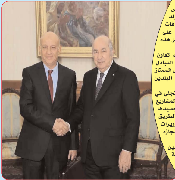
استقبل السيد رئيس الجمهورية، أمس الثلاثاء، عبد الكريم بن مبارك الأمين العام الجديد لحزب جبهة التحرير الوطني (الأفلاخ). وجاء في بيان لرئاسة الجمهورية، أن الاستقبال تم بطلب من بن مبارك.

أعرب السفير الجديد للجمهورية الإسلامية موريتانية، السيد سيدي محمد عبد الله، يوم الاثنين، عن اعتزاز بلاده بالعلاقات الأخوية الجزائرية-الموريتانية وتطلعها إلى تعزيز وتوسيع هذه العلاقات لتشمل كافة الميادين. وفي تصريح صحفي، عقب تسليم أوراق اعتمادته بصفتها سفيرا جديدا لبلاده لدى الجزائر، إلى رئيس