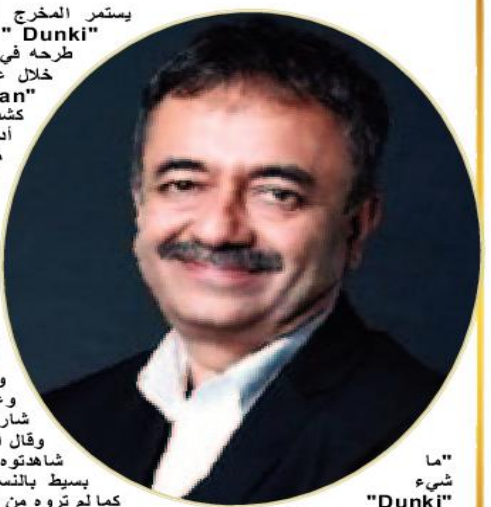
ما شىء "Dunki"

وأعلن أيضا عن "البوستر" الرسمي للفيلم و علق قائلا: "أن الفيلم يعد رحلة جندي للوفاء بالوعد، و من المقرر أن يعرض الفيلم في 21 ديسمبر القادم"، كما تدور أحداث الفيلم في إطار من الكوميديا و الدراما عن رحلات الهنود عن طريق الهجرة الغير شرعية إلى دول مثل كندا و الولايات المتحدة الأمريكية.