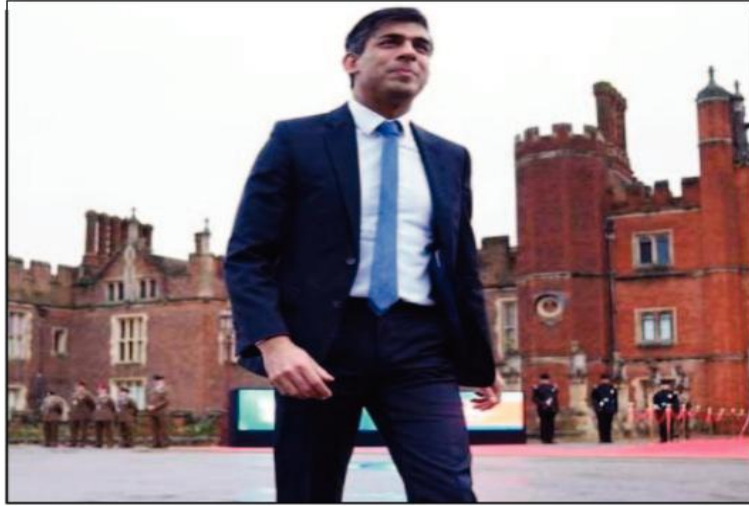
بالقمة بقيمة 29.5 مليار جنيه (دولار)، على الرغم من أن 10 مليارات إسترليني من هذه الاستثمارات قد تم الإعلان عنها بإستراتيجيته.

نفى رئيس الوزراء البريطاني، ريشي سوناك، أن تكون خططه الاقتصادية على وشك أن تقدم جولة جديدة من التقشف، حتى على الرغم من أن هيئة الرقابة المالية الرسمية حذرت من أن استراتيجيته لخفض الضرائب تفترض ضغطاً كبيراً في الخدمات العامة المترهلة.