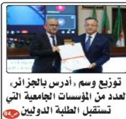
توزيع وسم «أدرس بالجزائر» لعدد من المؤسسات الجامعية التي تستقبل الطلبة الدوليين

لجنة رفيعة المستوى لتقييم دفتر شروط اختيار سيناريو فيلم عالمي حول الأمير عبد القادر