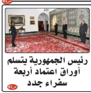
رئيس الجمهورية يتسلم أوراق اعتماد أربعة سفراء جدد