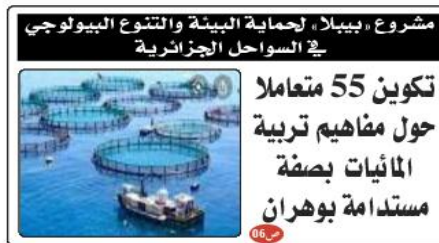
مشروع «بيبلا» لحماية البيئة والتنوع البيولوجي في السواحل الجزائرية

تكوين 55 متعاملا حول مفاهيم تربية المائيات بصفة مستدامة بوهران