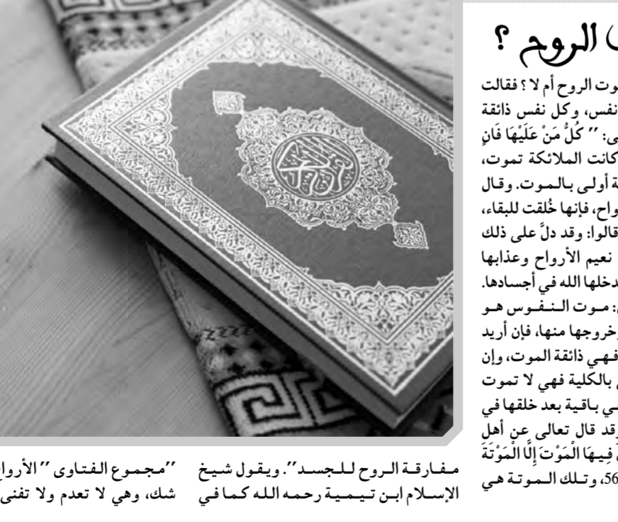
مجموع الفتاوى الأرواح مخلوقة بلا شك، وهي لا تعدم ولا تنفث، ولكن موتها مفارقة الروح للجسد. ويقول شيخ الإسلام ابن تيمية رحمه الله كما في

بمفارقة الأبدان، وعند النفخة الثانية تعاد الأرواح إلى الأبدان. وقد دل على ذلك الأحاديث الدالة على تعميم الأرواح وعذابها بعد المفارقة إلى أن يرجعها الله في أجسادها، وقد أخبر سبحانه أن أهل الجنة “ لَا يَدْخُلُونَ فِيهَا الْمَوْتُ إِلَّا مَوْتَهُمُ الْأُولَى ” الدخان: 56، وتلك الموتة هي مفارقة الروح للجسد. وقال النووي رحمه الله معلقاً على حديث النبي صلى الله عليه وسلم عن الشهداء، والحديث في “صحيح مسلم” وفيه: “أرواح في أجواف طير خضراء، لها فتاديل معلقة بالعرش، تُشرح من الجنة حيث شاءت، ثم تأتي إلى تلك القناديل” . فقال النووي رحمه الله قال القاضي عياض: “إن الأرواح باقية لا تنفث، فينم الحسنة، ويغضب السيئة، وقد جاء به القرآن والآثار وهو مذهب أهل السنة” .