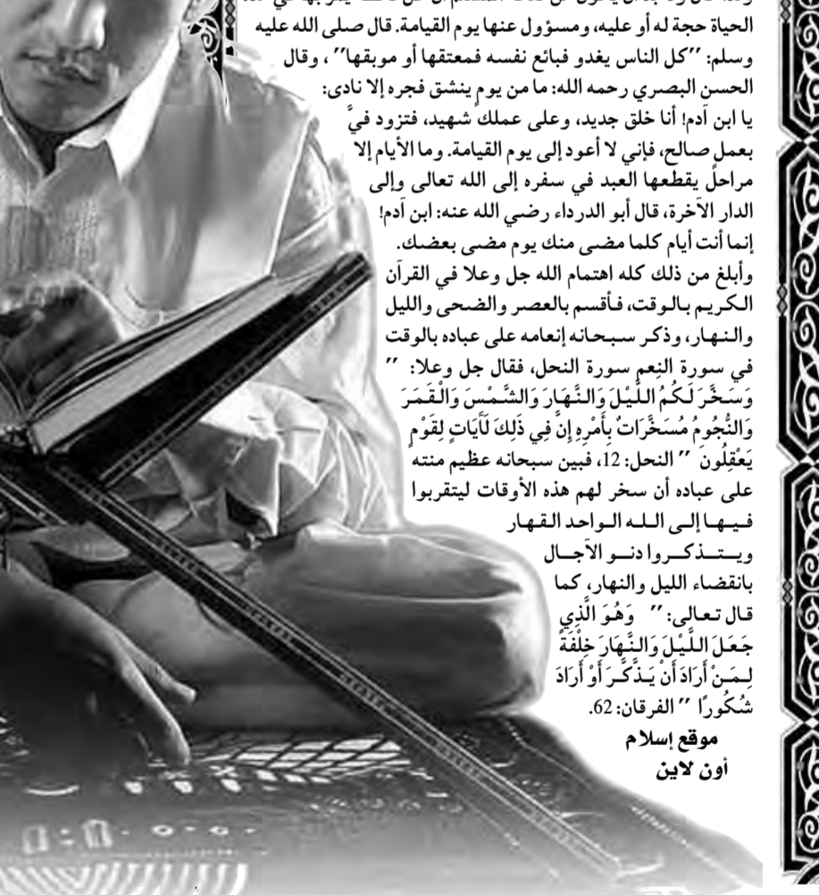
موقع إسلام أون لاين

بمفارقة الأبدان، وعند النفخة الثانية تعاد الأرواح إلى الأبدان. وقد دل على ذلك الأحاديث الدالة على تعميم الأرواح وعذابها بعد المفارقة إلى أن يرجعها الله في أجسادها، وقد أخبر سبحانه أن أهل الجنة “ لَا يَدْخُلُونَ فِيهَا الْمَوْتُ إِلَّا مَوْتَهُمُ الْأُولَى ” الدخان: 56، وتلك الموتة هي مفارقة الروح للجسد. وقال النووي رحمه الله معلقاً على حديث النبي صلى الله عليه وسلم عن الشهداء، والحديث في “صحيح مسلم” وفيه: “أرواح في أجواف طير خضراء، لها فتاديل معلقة بالعرش، تُشرح من الجنة حيث شاءت، ثم تأتي إلى تلك القناديل” . فقال النووي رحمه الله قال القاضي عياض: “إن الأرواح باقية لا تنفث، فينم الحسنة، ويغضب السيئة، وقد جاء به القرآن والآثار وهو مذهب أهل السنة” .