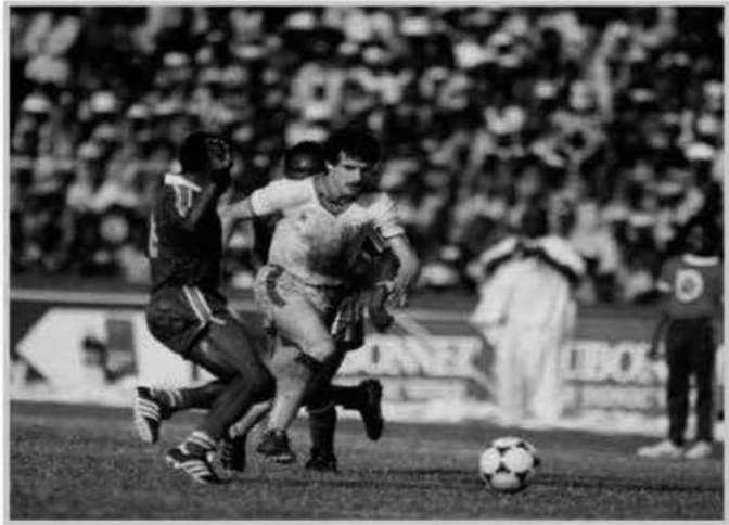
الدقيقة 44 من أحداث الشوط الأول من المباراة.