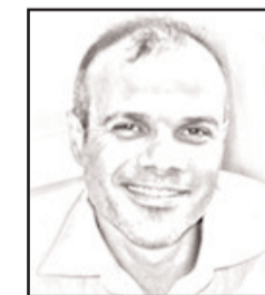
■ بقلم: حازم عياد

والفلسطينيون توارثوا الحرب أبا عن جد منذ بداية الاحتلال، وأول منبحة كانت بدير ياسين مع بداية الاحتلال سنة 1948، وما تلاها بعد بالعشرات، لكن حرب غزة الأخيرة كانت الأقوى والأفدح في خسائرها وعدد ضحاياها ودمارها، في حق سكان القطاع، الذين بلغ عدد ضحاياهم الخمسة عشر ألف (15 ألف) شهيد، وعشرات الآلاف من الجرحى والمعطوبين والمصابين والأيتام والأرامل. وشنت هذه الحرب الوحشية كرد فعل انتقامي على الإهانة المذلة التي لحقت بإسرائيل كدولة متعالية ولجيشها الذي ادعى أنه لا يقهر، وصفعة مدوية لأجهزة استخباراتها ويدها الطولى في المنطقة، وتجنيد المئات العملاء في المنطقة وحتى داخل غزة، ولم تجد إسرائيل مبرراً يقنع أحداً من شعبها ومن مناصريها وهم كثري