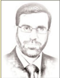
■ بقلم: عبد الله المجالي

رغم أن أحد أسباب عملية طوفان الأقصى كان ما يتعرض له المسجد الأقصى من انتهاكات، إلا أن العدو استطاع ببشاعة وضخامة جرائمه في غزة أن ينحني ما يجري في الأقصى جانبا. العدو يشن عدوانا شاملا على فلسطين؛ على جبهة غزة، وعلى جبهة الضفة الغربية، وعلى جبهة الأقصى، وحتى على جبهة فلسطيني الداخل.