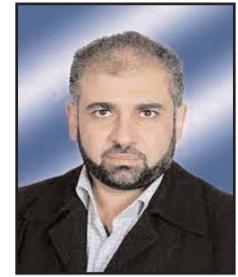
■ بقلم: مصطفى يوسف الداودي

لا مقارنة البتة بين أخلاق المقاومة الفلسطينية النبيلة ومناقبيتها العالمة، وشيمها العربية الأصيلة ومفاهيمها الإسلامية السمحة، وقيمتها العسكرية وضوابطها القانونية خلال الأعمال الحربية الضارية، في تعاملها مع الأسرى والمعتقلين الإسرائيليين، ممن يوصفون بأنهم مدنيون من الأطفال والنساء، رغم أنهم مستوطنون وأتباع كيان محتل غاصب قاتل ومعتمد، لا يزال يمارس القتل والبطش والإرهاب ضد المدنيين الفلسطينيين من الأطفال والنساء والشيوخ، ويدمر الحجر ويحرق الشجر، ولا تتوقف غاراته الوحشية على سكان القطاع ليلاً ونهاراً، في سمرية من العدوان لا تفتقر، وديمومة من القتل لا تشبع.