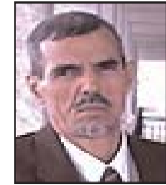
■ بقلم: الطيب بن ابراهيم

إن أحسنت المقاومة الفلسطينية في تعاملها مع أسراها الإسرائيليين، ولم