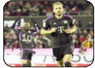
واصل الدولي الإنجليزي، هاري كين، تقديم عروضه الرائعة مع بايرن ميونخ في مسابقة الدوري الألماني، بعدما قاده للفوز على كولن (1-0)، في افتتاح منافسات الجولة الثانية عشرة من البطولة. ودخل بايرن ميونخ المباراة بطموح استعادة هيئته التي تآثرت بعد إقصائه من كأس ألمانيا على يد فريق من الدرجة الثالثة، أما على الصعيد القاري، فحسم تأهله إلى ثمن نهائي دوري أبطال أوروبا.

وواصل كين عروضه القوية منذ انضمامه إلى العملاق البافاري بداية الموسم الحالي، وأحرز