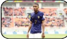
العالمية التي تتكفل بدراسة الملف بسرعة قبل إصدار قرارها. ويبلغ المنتخب الفرنسي منتخب أوزبكستان، ولم يؤجل "فيفا" هذه المواجهة رغم علمه بالتجاوز الذي ارتكبه منتخب "الديوك".

إيسوفو في المباريات الأولى من كأس العالم لثثة أقل من 17 سنة. في وقت كان خاص تصفيات هذه المنافسة مع منتخب النيجر وهشل في التأهل معه. وتمنع نوانج "فيفا" أن يخوض أي لاعب تصفيات أو بطولة مشتركة مع منتخبين مختلفين، كما يعاقب على التجاوز المعني بالتجاوز. خاصة أن جميع المنتخبات تكون أمام مسؤولية التأكد من وضعيات اللاعبين قبل انطلاق المنافسات. وضعت المنتخبات التي واجهت فرنسا في الأدوار الأولى فرصة الحصول على نقاط المباريات وحتى بطاقة التأهل، وكان الشرط الوحيد التقدم بشكوى لدى الهيئة