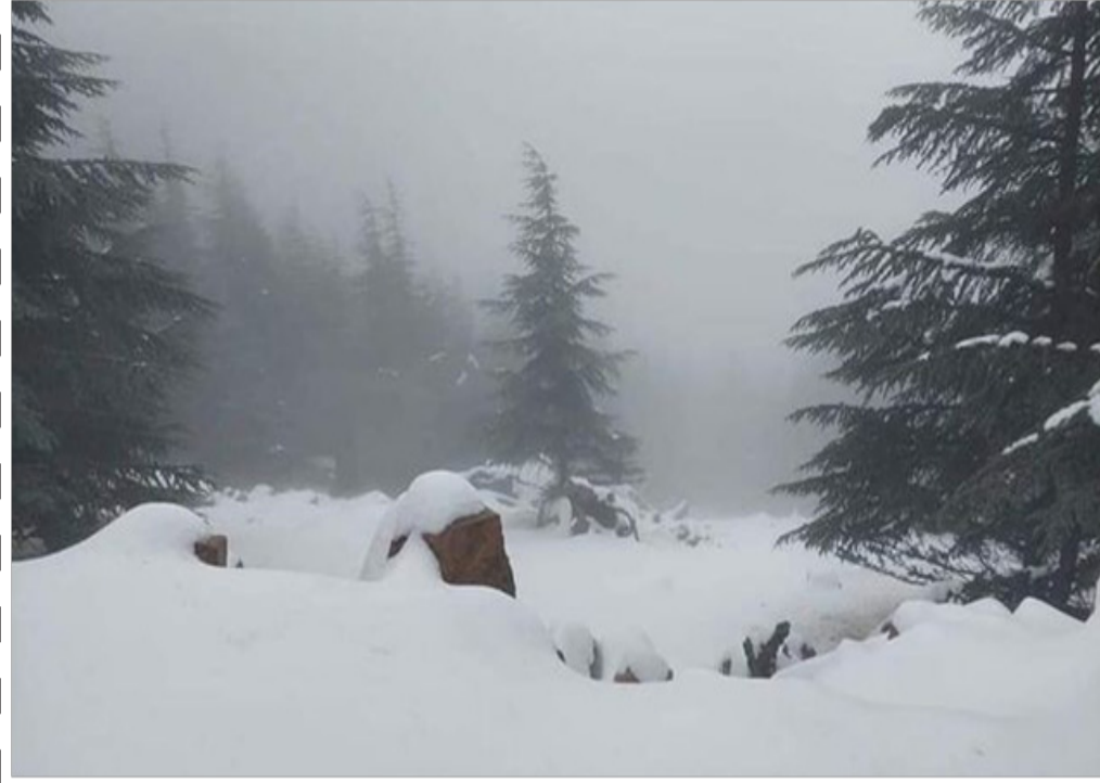
صورة الثلج من أعالي جبال شيليا ولاية خنشلة أمس