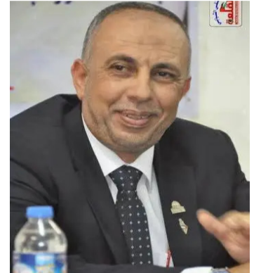
بِقلم / الدكتور جمال عبد الناصر / محمد عبد الله أبو نحل

وعلى الرغم من حجم الدمار الكبير، والحصار وتصريحات عصابة جيش العدو الفجار الغادر الناهق كالحمار؛ من الذين لا ضمير لهم، ولا إنسانية عندهم فحاصروا المستشفيات، والمدارس وقصفوها، واقتحموها، والأجنة قتلوها، والطفولة البريئة اغتالوها وبعض جلود جناتنا الشهداء من مُستشفى الشفاء سرقوها لبيعوها. والنساء في غزة قصفوها، وقتلوا، وحتى الإنسانية وتُذوها وأبادوها، وما رحموها؛ وأرض غزة دنسوها، ودمروها، وفجروها وخربوها والعائلات والعمارات عن وجه الأرض مسحوها، وأزالوها، وما أبقوها؛ ومن نجى من سكانها صاروا من جديد لاجئين، ونازحين؛ وفي هذه المعركة يا وحدنا في