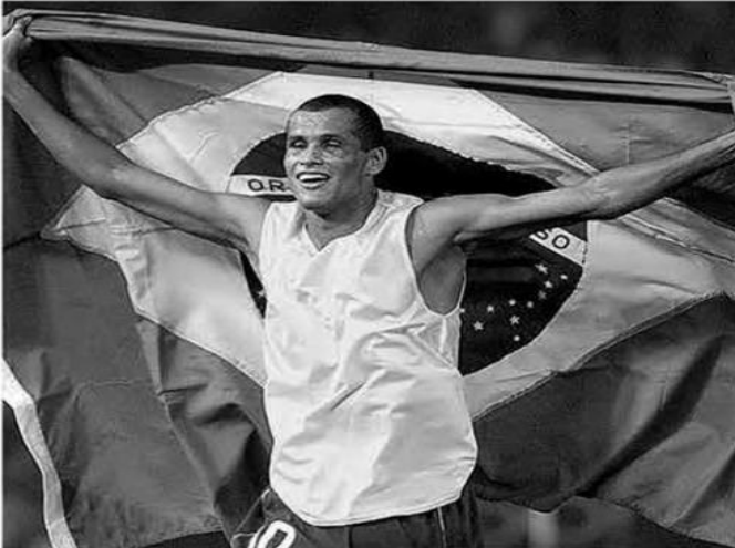
برصيد 35 هدفاً من 74 مباراة لعبها ريفالدو «مارادونا البرازيل».. هفوة أولمبية تصنع التاريخ

عادة ما يكون اللاعب رقم 10 في دول أمريكا الجنوبية هو نجم الفريق الأبرز أو صانع ألعابه والمحرك الرئيسي له، لاسيما في البرازيل والأرجنتين يكون اللاعب رقم 10 هو الأكثر مهارة وحرفية. وهكذا بات تقليدا منذ ارتداء الجوهرة السمراء بيليه والأرجنتيني الأشهر دييغو مارادونا، وبعد مرور السنوات ظهر نجم جديد يمتلك من المهارة والإمكانات ما يؤهله ليكون خليفة بيليه في ذلك الرقم وربما أيضا يقرب من نفس المكانة في زمنه وعصره الكروي داخل منتخب البرازيل، إنه الساحر الأصغر ريفالدو فيرييرا.