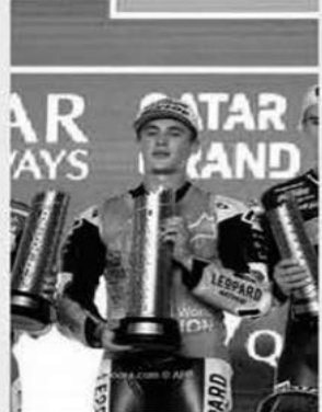
3، لافتا إلى قوة المنافسة، وهو ما ظهر جليا في حسم المراكز الأولى في لفئة الأخيرة. وصار الإسباني خاومي ماسيا ثامن دراج

فوز بلقب فئة الموتو 3، منذ استحداث سباق هذه الفئة في عام 2012. كما سبق له التتويج بلقب ثلاث جولات سابقة في بطولة العالم في كل من هولندا والهند واليابان، وذلك قبل أن يحقق الفوز في جائزة قطر الكبرى. ورفع ماسيا جمعد إحرازه جائزة قطر الكبرى- عدد تتويجاته إلى عشرة، خلال مسيرته في جولات بطولة العالم للموتو 3، ليعدل رقم السراج الإيطالي دينيس فوجيا في المركز الثالث، في قائمة الدراجين الذين حققوا أكبر عدد من الانتصارات منذ عام 2012، وذلك خلف الإيطالي رومانو فيناتي صاحب الرقم القياسي برصيد 13 فوزا، والإسباني خوان مير الثاني برصيد 11 فوزا. وأصبح في رصيد ماسيا بعد تتويجه بجائزة قطر 271 نقطة في مسدرة الترتيب العام، متقدما على الياباني إيماو ساساكي صاحب المركز الثاني برصيد 243 نقطة، في حين يأتي الكولومبي ديفيد أونسو في المركز الثالث برصيد 225 نقطة، بينما يحتل الإسباني دانيال هولغانو المركز الرابع برصيد 212 نقطة، وهو نفس رصيد التركي دينيز أونسو الذي أكمل قائمة المراكز الخمس الأولى.