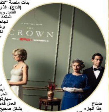
ضئاع هذا الجزء