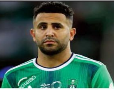
غلوب سوكر 2023:

محرز ضمن المرشحين لنيل جائزة أفضل لاعب في الشرق الأوسط