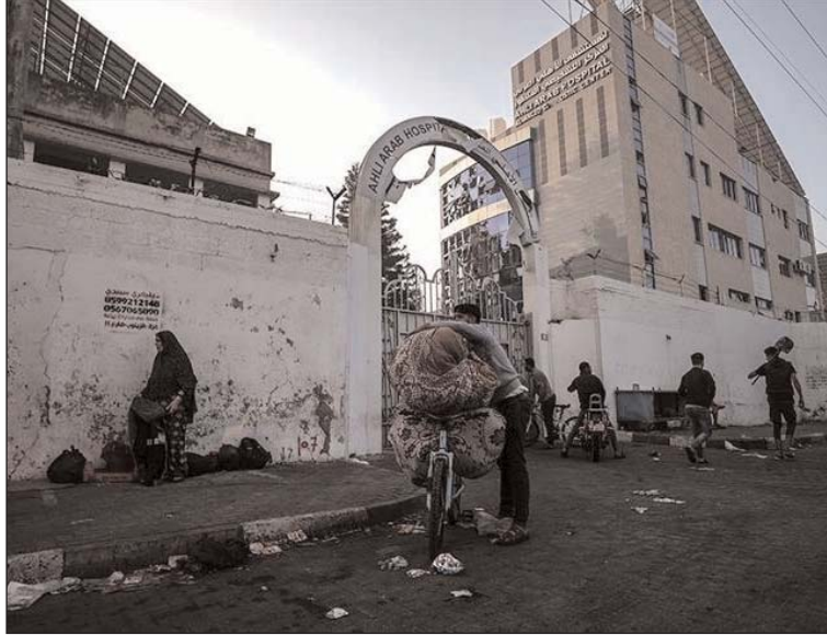
بالموارد الطبية والوقود.

يتواصل العدوان على غزة لليوم الـ 47، حيث استمر القصف مستهدفا المستشفيات والمدارس والمخيمات، مما أوقع مزيدا من الشهداء والجرحى، في حين تخوض المقاومة الفلسطينية اشتباكات في عدد من المحاور بمدينة غزة وشمال القطاع، وقالت المصادر إن أكثر من 20 شهيدا سقطوا في قصف الطائرات منزليين في مخيم النصيرات وسط قطاع غزة، في حين استهدف قصف الاحتلال مدرسة تؤولي النازحين غربي مخيم جباليا.