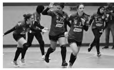
العربية للأندية إناث تعرف مشاركة

الأفريقي على نادي كركوك العراقي (12-28). أما النادي الجزائري الثالث المشارك في هذه الدورة، نادي فتيات بومرداس فقد انهزم أمام الأهلي السعودي (31-23). أما المباراة الثانية لهذه المجموعة فستجمع لاحقا نادي الرجيش التونسي بنظيره العراقي أربيل. يذكر أن منافسة البطولة