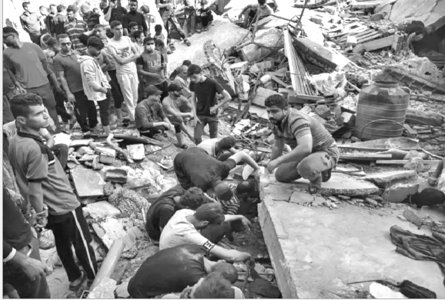
روما الأساسي للمحكمة الجنائية الدولية تعتمد توجيه هجمات ضد المدنيين".

يواصل الاحتلال الصهيوني عدوانه الغاشم على قطاع غزة لليوم 46 على التوالي، مستهدفا المستشفيات والمدارس التي تؤوي مئات الآلاف من النازحين والمنازل الآمنة التي يتم قصفها وهدمها على رؤوس ساكنيها، لتتصاعد بذلك حرب الإبادة الجماعية بحق الآلاف من أبناء الشعب الفلسطيني أمام أنظار العالم .