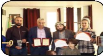
يعنوان "فغانية والسيرك" والتي سيتم برمجة عرضها الشرفي خلال العطلة المدرسية الشتوية المقبلة.

غانية وهي فتاة تعب عمل الخير والساحرة التي تتسبب في مشاكل لدى أصدقاء غانية. وأبرز ذات المصدر أن هذا العرض المسرحي يعد أحدث انتاجات الجمعية المذكورة والتي سبق لها إنتاج منذ سنة 2016 مسرحيات خاصة بمسرح عرائس القراقوز متمثلة في "غانية والماريونات"، و"غانية والبراءة الصادقة"، و"غانية والحب الأبدى". كما قام أعضاء من الجمعية بتأطير ورشة خاصة بمسرح عرائس القراقوز خلال هذا المهرجان الدولي الذي عرف مشاركة 70 فرقة مسرحية من 20 بلدا، ومن جهة أخرى، تضرع جمعية الفنون الدرامية لولاية معسكر حاليا مسرحية لعرائس القراقوز