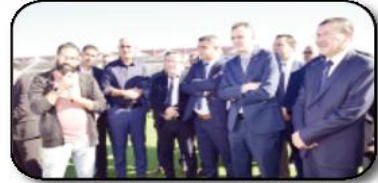
دشّن وزير الشباب والرياضة عبد الرحيم حماد، أمس الاثنين، مسبح نصف أولي ببلدية الطاهير، ولاية جيجل. تلقى وزير الرياضة، الذي يقوم بزيارة تفقدية لولاية جيجل، شروحات تتعلق بهذا المرفق الرياضي الهام والذي يعتبر مكسبا هاما للشباب ورياضيين المنطقة. وبالمنااسبة، شدّد الوزير على ضرورة الاهتمام والعناية به وتخصيص حصص مساحة لتأدية الاطفال المتدمرسين في اطار برنامج الرياضة

المدرسية على أن تكون خارج أوقات الدراسة. وفي بلدية السطارة، دشّن الوزير المُرَبّي الرياضي الجوّاري، هي منشأة تعدّ مكسب هاما للشباب والرياضيين، حيث أمر بضرورة الاستثمار في المواهب الرياضية التي تزخر بها المنطقة. ووقف حماد على نشاطات لجمعيات محلية، منسّدا تعليمات للتكفل بالوسائل التعليمية البديعوية لتأدية فئة أطفال التوحد مع تخصيص فضاء لممارسة نشاطاتهم كباقي الشباب. وأعطى الوزير بعمية الوالي إشارة انطلاق مشروع تعهّدية الملعب البلدي السطارة بالعشب الاصطناعي مشددا على ضرورة التزام الاجال المحددة ليدخل حيز الخدمة في أقرب وقت. والجهة الراعية لوزير الشباب والرياضة كانت ببلدية البليدة، حيث تفقد وعين مشروع المسبح الصّفّ الولبي، ووقف على ظروف إجاز هذا الهيكل الرياضي الذي يعتبر إضافة إيجابية لحضيرة مؤسسات القطاع بالولاية. وهنا شدّد حماد على ضرورة الالتزام بالهياكل الدولية في الإجاز ووضع حيز الخدمة في أقرب الاجال.