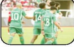
لمناسبة مطلع العام المقبل بمباريات تحضيرية لكأس أمم أفريقيا القادمة، وخاض المنتخب الجزائري 10 مباريات في 2023، حقق فيها 7 انتصارات و 7 تعادلات، مع الإشارة إلى أن آخر خسارته للخضر كانت قبل عام بالضبط أمام المنتخب السعودي خلال لقاء ودي جمعهما في مدينة مالو.