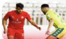
اللقاء بصممع 7 نقاط. وكانت مباريات هذه الجولة قد جرت يومي الجمعة والسبت، وعرفت تعزيز مولودية الجزائر صدارتها بعد "سحقها" لتضيق شبيبة الساورة برعاية

نخلة، راهة رصيدها إلى 15 نقطة. في حين، حافظ نادي بارادو على مركز الوصافة عقب فوزه على مضيئه نجم بن عكنون (0-1)، راهة رصيده إلى 13 نقطة. في الوقت الذي حققت فيه مولودية وهران أول فوز لها في الموسم على حساب الشيف اتحاد خنشلة 0-1. وتجرى الجولة السابعة نهاية الأسبوع المقبل، حيث ستعرف تنقل المتصدر مولودية الجزائر إلى الوادي للقاء اتحاد سوف، فيما سيكون ملعب 8 ماي 1945 بسطيف مسرحا للقاء بين الوفاق الحلي والشيف شباب بلوزداد.