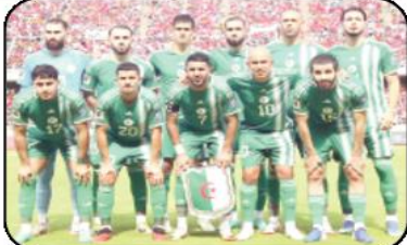
بعد إكمال المرحلة الأولى من التصفيات المؤهلة إلى مونديال 2026، ارتقى المنتخب الوطني إلى المركز الـ 29 عالميا.

ارتقى المنتخب الوطني إلى المركز الـ 29 عالميا، في تصنيف "الفييفا" الجديد، المقرر صدوره يوم الـ 30 من شهر نوفمبر الحالي، وكسب الخضر 4 مراكز في التصنيف الجديد، حسبما أكد موقع "فوتباليستكس" الخاص بتصنيف المنتخبات، وذلك عقب تصفيته انتصارين في أسبوع "الفييفا" أمام الصومال وموزمبيق، ضمن التصفيات المؤهلة إلى مونديال 2026. كما أوضح المصدر ذاته، بأن المنتخب الوطني الذي تواجد في التصنيف الـ 33 عالميا أكتوبر الماضي بتقييم 1512.89، أصبح حاليا في المركز الـ 29، بعدما كسب 7.36 نقطة إضافية. وسمح هذا التقدم الكبير للمنتخب الوطني في تصنيف "الفييفا" بالصعود إلى المركز الثالث إفريقيا. متقدما على المنتخب التونسي، الذي تراجع إلى المركز الخامس، فيما تواجدت مصر رابعة والسفالي في الوصافة والمغرب في الصدارة.