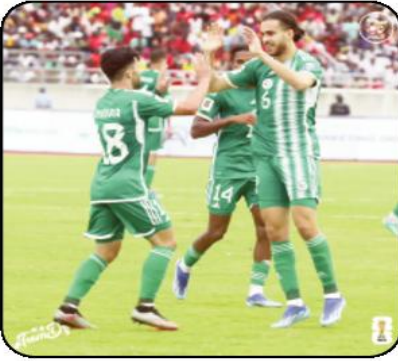
وأهدى الخضر ثلاث نقاط وأهدى الخضر ثلاث نقاط، بينما يكون بلماضي قد اقتنع بأن مكان عمورة في التشكيلة الأساسية أصبح لا الإفريقية.

نقاش فيه، وهو الحال ذاته بالنسبة لشايبي، الذي أظهر نجاعة أكبر وحسنا تهديفيا عندما شارك في منصبه الأصلي خلال الشوط الثاني كجناح أو مهاجم وهمي، وهو الدور الذي يشغله في ناديه أينترناخت فرانكفورت الألماني. قبل أقل من شهرين عن انطلاق نهائيات كأس أمم أفريقيا 2023 بكونت ديفوار، يبدو أن بلماضي قد وجد التوليفة الهجومية المناسبة لإحو الصورة السنية التي ظهر بها المنتخب في "كان" 2021 بسالكاميرون، حيث سيكون لشايبي وعمورة شأن كبير في قيادة الأمانة الهجومية لمحاربي الصحراء، من أجل استرجاع كبرياتهم والبحث عن النجمة الثالثة على الأراضي الإفريقية.