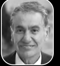
بقلم: جلال محمد حسين نشوان