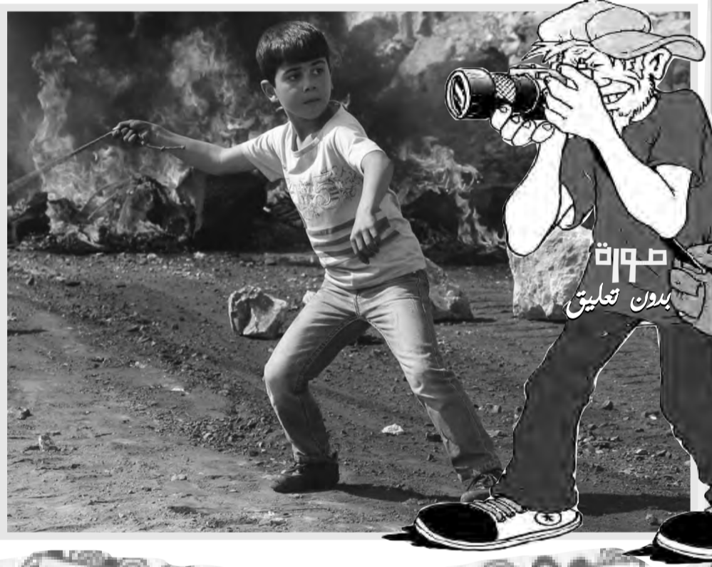
صورة بدون تعليق

وفي هذا السياق، قال الدكتور تيدروس أدهانوم غيبريسوس، المدير العام لمنظمة الصحة العالمية: «إن التعرض غير المبرر للأشعة فوق البنفسجية الشمسية في العمل هو سبب رئيسي لسرطان الجلد المهني، لكن هناك حلول فعالة لحماية العمال من أشعة الشمس الضارة، ومنع آثارها الضارة». وقال جيلبرت ف. أنغبو، المدير العام لمنظمة العمل الدولية: «إن بيئة العمل الآمنة والصحية هي حق أساسي في العمل، والوفاء بالتزامات منظمة العمل الدولية، للأشعة فوق البنفسجية الشمسية أثناء العمل يمكن الوقاية منها إلى حد كبير من خلال تدابير فعالة من حيث التكلفة». ودعا جيلبرت الحكومات وأصحاب العمل وممثلي العمال بضرورة حماية العمال من الأشعة فوق البنفسجية للحد من المخاطر المهنية الناجمة عن التعرض لها، وإنقاذ آلاف الأرواح كل عام.