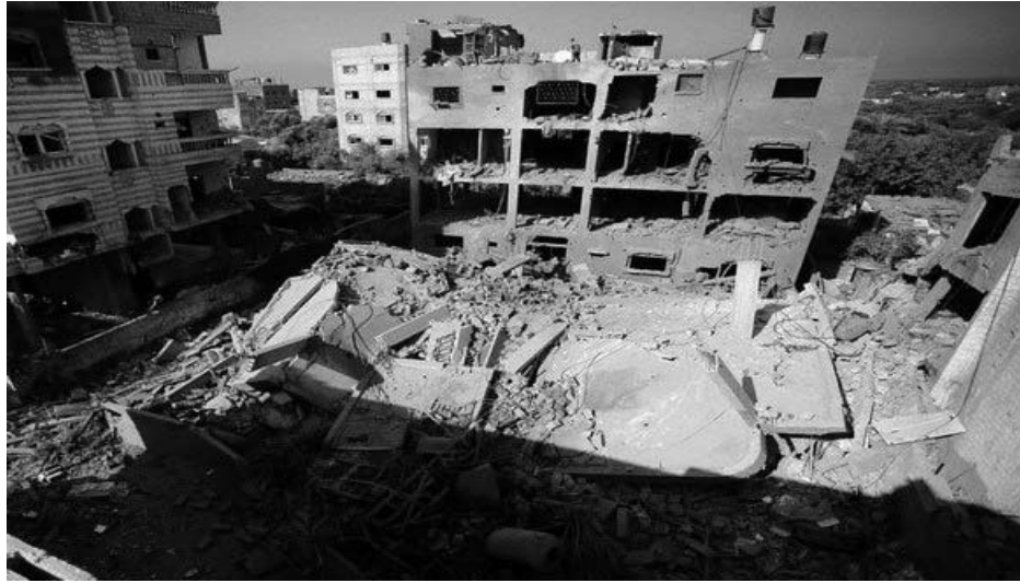
الشعب الفلسطيني وذهب الشهداء والجرحى، مطالباً بوقف المجازر وجرائم الحرب التي يصر الاحتلال الصهيوني على ارتكابها

وفي إطار مشابه، تظاهر مئات الأشخاص في تل أبيب ضد حرب الاحتلال الإسرائيلي على قطاع غزة، ونظم المظاهرة حزب "حداش اليساري" وفق وسائل إعلام الاحتلال الإسرائيلي. وكتب على إحدى اللافتات "العين بالعين، وكلنا عميان". وذكرت قناة "كان" التلفزيونية أن المتظاهرين طالبوا بتغيير "أسوأ حكومة في تاريخ إسرائيل". في المقابل، ذكر موقع صحيفة يديعوت أحرونوت الصهيونية أن هناك مظاهرة مضادة شارك فيها عشرات المشاركين. ووقعت مواجهات لفظية وجسدية بين الجانبين.