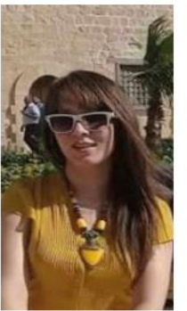
انتظرتك .. على ضفاف الشوق .. وييمناي باقة من حب ملونة ..