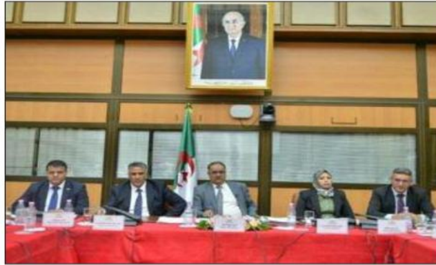
الجمهورية بمناسبة الزيارة التي قام بها لولاية الجلفة.