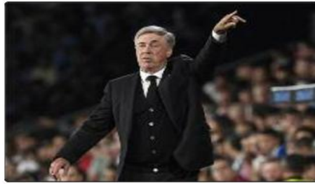
مدريد أنشيلوتي أفضل شخص لمواصلة عرض القيادة للمدرب الإيطالي بشأن التجديد.

وتابعت: «تحويل رغبة إدارة ريال مدريد إلى عرض رسمي لا يعد أمرا عسوريا في الوقت الحالي، لا سيما أن كلا من بيريز وأنشيلوتي يعرف ما يريد الطرف الآخر». وقالت «ماركا»: «ستعين علينا الانتظار لمعرفة إذا كان ريال مدريد سيقدّم عرضا جديدا لأنشيلوتي، لكن هذا الانتظار لن يطول، حيث يدرك مسؤولو الريال أن لا يمكن تأجيل الأمر حتى نهاية الموسم لاتخاذ القرارات». وختمت: «لقد انتظرت الإدارة حتى نهاية الموسم في السنوات الأخيرة لمناقشة مصير المدرب، لكن العلاقة مع أنشيلوتي الآن أصبحت مختلفة».