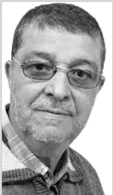
بقلم قرار المسعود

القوانين الأمية التي تجاوزها الزمن منذ 1945 و احترام المجتمعات و الدول كيف ما كانت و تجسيد نمط اقتصادي خالي من الهيمنة و التسلط. عندما يمتلك الإنسان كل موازن القوة يرى الظلم حق و الحق ظلم فيفعل ما يريد و لا يبالي و يتجر و يتسلط و كل ضعيف يتحول الى خادم مطيع له و يخيل له أنه هو الوحيد الذي يمتلك الحل و التسيير حتى يصل به الأمر الى الربوبية، حينئذ تقرب نهايته. فما نراه في الساحة يشبه صورة فرعون و لا يستطيع أحد أن يقنع الغرب و يتقبلوا الواقع الذي يعيش فيه الطرف الأخر إلا بالقوة التي تجرهم على الامتثال. فالطريقة التي تسير في غير اتجاههم تزعجهم و تقلل من قوتهم و توسعهم و تنقص من اقتصادهم و نهب ثروة المستضعفين.