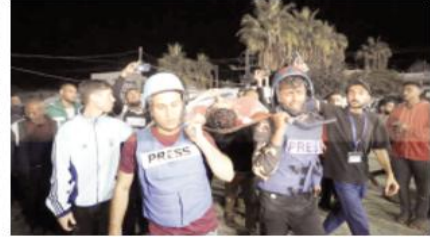
غزة، الذي تعرض أجزاء منه وحياة كل الموجودين فيه من الأطقم الطبية والجرحى