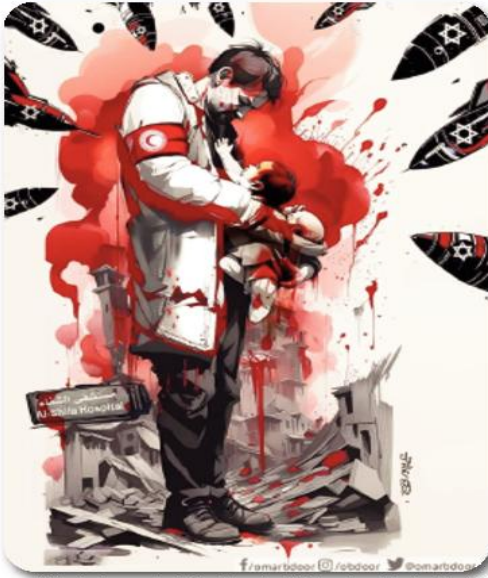
الفسيفساء أن هذا إسرائيل هو تقليص عدد الفلسطينيين إلى أدنى مستوى، ولذلك أجأت إلى التطهير العرقي والخنق الاقتصادي والسجن الديموغرافي ومنع مسيرة السلام وقيام دولة فلسطينية.

كم من الدم سيستغرق هذا الأمر لاشباع هذا التمطش للاقتحام؟ إلى متى ستستمر هذه النزعة الإبادة الإبادة؟ إلى متى ستتابع هذا المشهد المتعم بالاجرام كظاهرة جماعية وتتابين وجوباً عن الجريمة والتي تعتبر - وحسب العلوم الجنائية - ظاهرة فردية؟ لقد استندت أيدولوجية الكيان الإسرائيلي المحتل على الأيدولوجية الصهيونية والمتعلقة في الإمان في فرض يهودية الدولة والتي بدورها تحصل حاصل لتكررة وهل إسكات الزمن والتاريخ الفلسطيني من خلال الإبادة الجماعية للشعب الفلسطيني. وبتفخرة سريعة على ما ورد في بعض أسفار التوراة ترى الدعوة للإبادة مسوغ لتلعل الاجرام ضد الشعب الفلسطيني والعمل سياسياً وعسكرياً وثقافياً على الغائه. فقد ورد في سفر التثنية الأصاح 16/20 (قواعد الحرب لا تسمح بالبقاء على قيد الحياة، لا شيء، لا رحمة) وكما في الإصحاح 19/25 من ذات السفر (محو ذكر عماليق من الوجود، ويشمل الرجال والنساء والأطفال، ليس لهم الحق في الوجود). ورد في كتاب "فلسطين" مؤلفته المفكرين اليهوديين البروفيسور الاميركي نعام تشومسكي، والمؤرخ