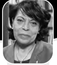
بقلم: أسماء ناصر ابو عياش