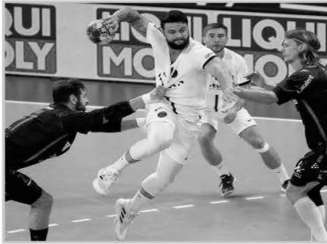
مهمة على حدة . تحتوي تدريبات جماعية وفردية لتحسين التعاون بين اللاعبين وتطوير مهاراتهم .

تعزيز كرة اليد اللياقة البدنية والصحة العامة للأفراد ، وتساعد في تحسين القدرات الحركية والتنسيقية والعقلية . - تساهم في تعزيز قيم العمل الجماعي والتعاون والتضامن بين اللاعبين ، وتعزيز العلاقات الاجتماعية والتواصل والتفاعل المباشر . تحقق كرة اليد شعبية كبيرة في العالم ، وتساهم