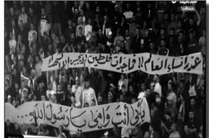
عذرا نساء العالم افرأجدين فلسطين لرحمة اربابكم

منعت سلطات الاحتلال الإسرائيلي بناء ملعب بيت أمره بترجمة أن الملعب يشكل تهديداً للأمن؛ لقربه من الشارع (خط 60). كما منعت قوات الاحتلال بناء ملعب بورين؛ حيث اقتحمت قوات إسرائيلية الموقع ومنعت الأعمال التحضيرية للبناء. وفي 21 تموز 2015 منعت سلطات الاحتلال الإسرائيلي إنشاء ملعب كرة القدم في وادي فوكين. - تدمير المنشآت القائمة: لم تكف سلطات الاحتلال الإسرائيلي بمنع وعزلة تشييد البنية التحتية للرياضة الفلسطينية؛ بل تعمل على تدمير المنشآت القائمة، لدرجة مهاجمة بعضها بالطائرات الحربية وقصفها بالصواريخ، كما حدث في 8/2/2008 عندما قصفت مدرج ملعب رفح البلدي؛ وقصفت ملعب فلسطين في مدينة غزة في 17/11/2012، وملعب البرموك في 21/11/2012 وكذلك قصفت مقر اللجنة الأولمبية الفلسطينية، واتحاد كرة القدم، وأندية اتحاد الشجاعة وأهلي النصيرات وخدمات دير البلح، وشباب جباليا، ونادي الشمس، ونادي الشهداء، وجماعي رفح، كما قصفت ملعب بيت حانون في 26/3/2019. - اقتحام المؤسسات والمنشآت الرياضية: تتعمد سلطات الاحتلال الإسرائيلي اقتحام المؤسسات الرياضية الفلسطينية لإرباك عملها وتضييق الخناق على نشاطاتها، كما حدث في اقتحام مقر الأولمبية الفلسطينية في البيرة بتاريخ 13/12/2018، وبتاريخ 6/1/2019 واقتحام مقر نادي شباب الخليل