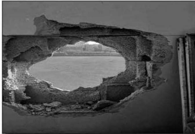
قامت قوة مسلحة إسرائيلية مدعومة بعناصر من الإدارة المدنية بهم الملعب، وأمرت بوقف عملية البناء، وهددت بسجن العمال ومصادرة الآلات. كما

بتاريخ 20/6/2015، واقام ملعب الخضر بتاريخ 1/5/2005، وبتاريخ 10/10/2018، واقتحام ملعب العمسوية بتاريخ 21/2/2017، واقتحام ملعب سلوان بتاريخ 31/10/2011، واقتحام ملعب فيصل الحسيني بتاريخ 12/4/2017، واقتحام ملعب مخيم شعفاط بتاريخ 2/5/2019..... الخ - إغلاق المنشآت الرياضية بأوامر عسكرية: درجت سلطات الاحتلال الإسرائيلي منذ القديم على اقتحام مياسة إغلاق المؤسسات الفلسطينية الرياضية؛ فقد سارت منذ العام 1967 إلى إغلاق مقر رابطة أندية القدس، وأغلقت نادي إسلامي سلوان في 24/1/2012، ونادي جبل الزيتون في 6/2/2014، وجمعية برج اللقلق في 31/8/2019، ومنعت إقامة دوري العائلات المقدسية في ملعبها بمشاركة 10 عائلات مقدسية - منع المؤسسات من إقامة وتنظيم الفعاليات الرياضية: تعمل سلطات الاحتلال الإسرائيلي على منع تنظيم العديد من الفعاليات الرياضية، وذلك عبر إصدار الأوامر، أو باستخدام القوة العسكرية. فقد اقتحمت قوة عسكرية احتلالية بتاريخ 4/3/2013 ملعب جبل الزيتون في بلدة الطور بالقرب من القدس، وكان الملعب يحضن لقاء رسمياً ضمن منافسات دوري تحت سن 14 عاماً، وجمعت المباراة فرقي "نادي جبل الزيتون" و"نادي الموظفين"، وهددت القوة المسلحة الأطفال في كلا الفريقين وتوبيخ الموظفين والجمهور بأنها ستعود لاستخدام القوة واعتقالهم إن لم يتم إخلاء الملعب؛ وسارت إلى