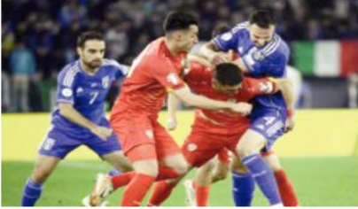
المرکز الثالث، بينما ظلت سان مارينيو بلا رصيد في قاع الترتيب، في الوقت الذي شهدت أيرلندا الشمالية 4-0.

حقق منتخب إيطاليا انتصاراً كبيراً على ضيفه منتخب مقدونيا الشمالية 5-2 على ملعب أولمبيكو، مساء الجمعة، ضمن الجولة التاسعة من المجموعة الثالثة للتصفيات المؤهلة إلى بطولة كأس أمم أوروبا 2024.