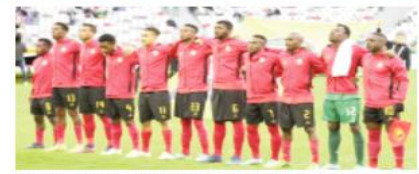
يرغب منتخب موزامبيق في إطاحة منتخب الجزائر عندما يتواجهان، اليوم الأحد، في العاصمة مابوتو، ضمن فعاليات

الجولة الثانية من المجموعة السابعة، الخاصة بالتصفيات الأفريقية لمؤهلة لبطولة كأس العالم المقررة في أميركا، كندا والمكسيك عام 2026. وقرر الاتحاد الموزمبيقى لكرة القدم، حسب بيان نشره الجمعة على موقعه الإلكتروني، تحفيز منتخب بلاده من أجل تحقيق المفاجأة والفوز على الضيف الجزائري، وذلك عبر تقديم ميكرو نحة الفوز على منتخب بوتسوانا (3-2)، في اللقاء الذي جمعهما، الخميس، ضمن الجولة الأولى من هذه التصفيات. وأكد البيان أن كل لاعب من منتخب موزامبيق سيحصل على مبلغ قيمته 1200 دولار بعد الفوز على بوتسوانا، مع إمكانية تقديم منحة أكبر في حالة الانتصار على المنتخب الجزائري ومنه تصدر