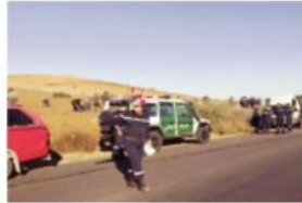
ارتفعت حصيلة وفيات حادث حريق شاحنة الذي وقع الاثنين المنصرم ببلدية البرية (وهران) إلى 8 وفيات، حسبما استُفيد السبت من مصدر استشفائي. واستنادا لباهي يمينة، مكلفة بالاعلام

بالمؤسسة المتخصصة في الحروق الدكتور وهراني فتحى مصطفى، فقد توفي الجمعة شخص ثامن متأثرا بإصاباته حيث كان يعاني من حروق من الدرجة الثالثة وذلك على مستوى المؤسسة المتخصصة في الحروق الدكتور وهراني فتحى مصطفى فيما لا يزال جريح آخر على مستوى مصلحة الإعاش بنض المؤسسة الاستشفائية. للتذكير، فقد خلف حادث حريق شاحنة من الحجم الصغير كان على متنها عمال على الطريق الرابط بين بلديتي البرية ووادي تليلات، وفاة خمسة أشخاص متضمنين بين الكان وإصابة أربعة آخرين بحروق توفي منهم ثلاثة متأثرين بإصاباتهم. للإشارة، فقد تم فتح تحقيق ابتدائي في هذا