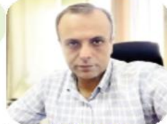
يقلم: الوائق طه

السيطرة على مقر المجلس التشريعي في غزة، الحمقى كان عليهم تأجيل إعلان وثيقة استقلالنا، هي صورة شبيهة لما حدث في العراق قبل عشرين عامًا بالضبط، وملائمة لهذا اليوم. ما الملائم فيها لا أعلم، لكنه احتفال فقد دقته في استغرابنا، لو كنت مكان هؤلاء لشترتها اليوم. مهلا... هل ساكون مكان هؤلاء يومًا ما؟ هل ساحمل بندقية محتل يفترض أمال شعب آخر ويشعل محرقة هبهم؟ أجاب جيت فلسطيني ناشط في كلاً. حملت هاتفني، كتب أحدهم تعليقًا على فيديو أولئك الفتيان الذين يتصفون الجيش بالهجرة "لحن الموت"... كانت الأغنية السويدية تليا فلسطين تصدح في خلفية الصورة، هي واحدة من الأغنيات والمقاطع الموسيقية المضلة، سأحكي لكم سزا صغيرًا... أنا لا أحب الأغنيات إلا بعضها، لكنني أحب الموسيقى، خصوصًا تلك الملحنة للأفلام والألعاب، التي تحفز الدماء، وتحرك الجماسة. خلال الأعوام الماضية، كنت انسحب إلى كهف خاص بي، أجلب غيومًا تخيم على صمتنا سوداء معتمة لأنشراها في غرتني تاركا شوه الشاشة مصدرًا للتأمل، ثم أحرض نفسي على نفض