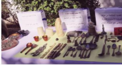
أشياء متآنية من عمليات الحفر من أجل جنحتي ببح وإخفاء، أو التفتيح مكتشفة بالصدفة.

تمكنت حصيلة الأبحاث للدرك الوطني بئر مراد رايس بالتنسيق مع فرقة حماية الممتلكات الثقافية بتبليزة، من الاطاحة بأربعة (04) أشخاص يقومون بالتجارة بالآثار والممتلكات الأثرية وكذا القطع المدنية الثمينة. العملية جاءت في إطار مكافحة الجريمة بشتى أنواعها وحفاظ على المورد الثقافي.