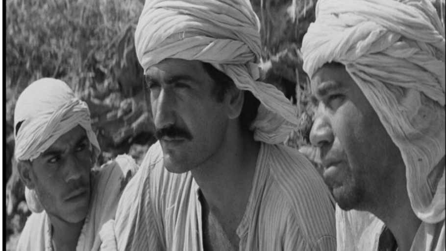
منتقاة من الأفلام التي قامت السينماتيك الملكية البلجيكية بترميمها ورقمنتها

ب «عناية» و«دقة فائقة»، وهي «سلسلة من أفلام عالمية كلاسيكية شهيرة وأفلام غير متوفرة أو مفقودة لتقدمها بصورة رقمية للأجيال القادمة». وضمن قائمة الأفلام المرممة المبرمجة للعرض هناك «الكلب الأندلسي» (1929) للمخرج الإسباني لويس بونويل، و«الساموراي» (1967) للفرنسي جان بيير ميلفيل، و«المحاكمة» (1962) للأمريكي أورسون ويلز، و«هاوس» (1977) للياباني نوبيهيكو أوباياشي، و«خوف ورغبة» (1952) للأمريكي ستانلي كوبريك، وغيرها من الأفلام النادرة. من جهة أخرى، سيعرض المهرجان أيضا دراما نادرة من روائع الأفلام القصيرة والمتوسطة على غرار أفلام المخرجة اللبنانية جوسلين صعب، كما يتضمن البرنامج تقديم محاضرة حول «الفن ومنهجية العثور واسترجاع الأفلام المفقودة».