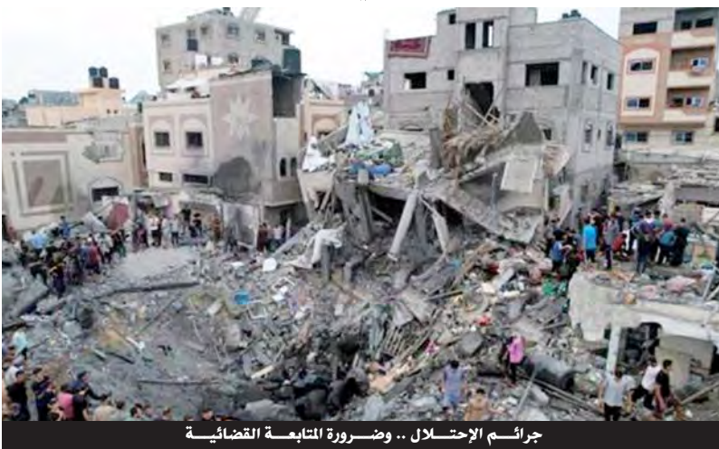
جرائم الاحتلال .. وضرورة المتابعة القضائية

يعمل خلالها الكيان الغاصب على الإفلات من العقاب أمام مرأى الجميع». وبذات المناسبة، شدد أستاذ القانون الدولي، حوري يوسف، على أهمية «رصد الجرائم التي يقرتها الكيان الصهيوني وتوثيقها لرفع دعوى قضائية أمام الجهات المخولة من محاكم دولية أو محاكم أوروبية بما فيها المحكمة الجنائية الدولية».