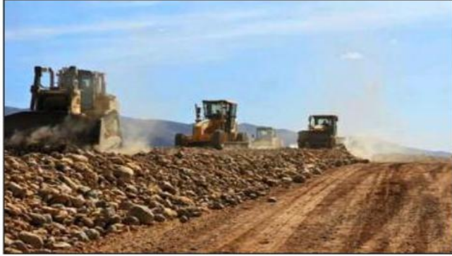
مركب الحديد والصلب الذي يوجد قيد الإنجاز بشار و ميناء آزرويه(وهران)، من شأنه كذلك إعطاء انطلاقة اقتصادية و اجتماعية جديدة لقادة جزء كبير من المنطقة و المساهمة في توظيفه.