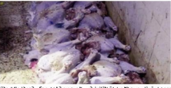
ويعد استيفاء جميع الإجراءات القانونية، وسيتم تقديم صاحب المذبح أمام وكيل

تمكن عناصر الدرك الوطني من اكتشاف مذبح سري للدواجن بالسحاولة (الجزائر العاصمة) وتم على إثرها توقيف 3 أشخاص مع حجز كمية من لحوم الديك الرومي شهر صالحه للاستهلاك، حسبما أفاد به الثلاثاء بيان مصالح الدرك الوطني.