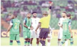
لعبه الفريق في فبراير الماضي، أمام نادي المريخ السوداني ضمن منافسات دوري أبطال أفريقيا لكرة القدم. وتبين لقطات تلك المباراة ارتكاب الحكم تراوري أخطاء فادحة، منها حرمانه نادي شباب بلوزداد من ركلتي جزء واضحتين واحتماسه أخرى أشارت جدلا لنادي المريخ السوداني، الذي كان قد حسم المباراة لصالحه بهدف نظيف.

صحيح، ثم حرم اللاعب نفسه من هدف آخر بحجة ارتكابه خطأ على حارس منتخب النيجر، لكن الإعادة أظهرت أيضا غياب الاحتكاك بينهما خلال تلك القطة.