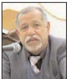
بِقلم: سعيد الشهابي

للحروب على عجل مخلفين وراءهم جنودا وعتادا بدون حساب. ما دام هناك فلسطينيون مصممون على استرداد أرضهم والتصدي للمحتل، فلن يكون بالإمكان تجاوز القضية يوما، ولن تستطيع القوة المفرطة تجميد فعل القوى الطبيعية. وقد أثبت الفلسطينيون على مدى ثلاثة أرباع القرن قدرتهم على التصدي للمحتل، والتمسك بالأرض والبقاء عليها مهما كلفهم ذلك. وبرغم ما شاهده العالم من اعتداءات إسرائيلية مروعة، ما يزال الفلسطينيون الرقم الأصعب في المعادلتين العسكرية والسياسية، وما يزال الإسرائيليون يعانون من رفض دولي شبه مطلق لمارساتهم. ولو كان هناك من شعوب العالم من يدعمهم لغير عن نفسه بتظاهرات واحتجاجات وحضور إعلامي وسياسي ملحوظ. وغياب ذلك يؤكد عدم وجود مزاج داعم للممارسات الإسرائيلية التي تنطوي على الكثير من الصلافة واللاإنسانية. كما أن الطبقة المثقفة والسياسية في العالم تدرك حقيقة المشروع الصهيوني. وقد تسربت مؤخرا وثيقة من عشر صفحات من وزارة الاستخبارات الإسرائيلية مؤرخة في 13 أكتوبر 2023، تقترح اقتلاع سكان غزة البالغ عددهم مليونين وثلاثمائة ألف، بالقوة وبشكل نهائي إلى سيناء في مصر. وهناك من الباحثين من يشعر بالصدمة الدائمة إزاء الثقافة الصهيونية التي تظهر مستوى كبيرا من الفاشية، حتى أن تنتاجها اعتبر ذبح الفلسطينيين مشروعا، إذ شبههم بالعمونيين، الذين قتلهم أعداؤهم من بني إسرائيل في القرن الثالث عشر قبل الميلاد. فلسطين لم تسقط ولن تسقط، فلا يزيدا كثرة الضحايا إلا صمودا وشموخا وانتصارا. إنها قصة النضال الذي أسس لحركات تحررية إقليمية وعالمية على مدى أكثر من نصف قرن، وسيظل مصدرا لرفدها بالبطء والحماس والاستمرار.