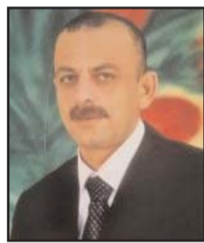
بِقلم: فتحي أحمد

شهور قليلة قادمة ستبدأ الدعاية الانتخابية وإذا ما استمرت وتيرة الحرب والعدوان على غزة بهذه الطريقة، فهذا يعني فقدان بايدن قدرته على بسط إملائه على دولة الاحتلال، وهذا ما صرح به دبلوماسي أمريكي رفيع المستوى، فضلا عن بعثرة أوراقه الانتخابية بين أوكرانيا وجاتحة كورونا التي هزت من شعبيته. فالناخب الأمريكي لا ينسى ويعيد حساباته جيدا، من هنا يصعب وقتها لملمة ما حملته رباح كوريا وحرب أوكرانيا وغزة والنتيجة ألفتما فيها وتخلت. لقد كانت لبايدن فرصة ربما تحقق له الفوز برئاسة ثانية قبل الحرب من خلال مشروع