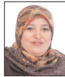
بِقلم: الدكتورة سميرة بيطام

ورجال عزل أصبحوا على دوي الغدائف التي هدمت أسقفا لبنياتهم، وسبقها في ذلك صفارات الإنذار التي كانت تدوي من حين لآخر، على أن يبقى الشرط معلقا لوقف الاقتتال هو اطلاق الرهائن والا فلا وقف لهذه الحرب. لحد الساعة الكل متفق على أن الحرب على غزة لم تكن متوقعة ولا منظرية، لكن الذي لم يتفق عليه بالإجماع من تابع الأحداث من العرب والمسلمين هو السكوت الطويل لحكام في أن يقفوا وقفة رجل واحد وعلى قلب واحد قريبا من غزة ، لنتوالى الأسماء في السقوط شهداء تلفهم الأكفان وتجمعهم الصرخة الأخيرة أن الألم كان بليغا. قد يكون الضمير العربي متألما لما حصل وحزينا لما وقع ، ولكن الشرف العربي يتساءل عن النخوة والوحدة والهوية واتفق القيم والمبادئ على النصرة كالتى عهدتها المسلمون في غزواتهم وحروبهم دفاعا عن القيم الإنسانية وعن الحق أينما لفه التهديد