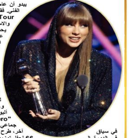
في سياق في الدورة الـ

وستنافس الأغني الأربعة مع أغنية "Lift Me Up" لريهاننا من الموسيقى التصويرية "Black Panther: Wakanda Forever". بالإضافة إلى ذلك، حصلت "Barbie" على ترشيحات لأفضل موسيقى تصويرية، موسيقى تصويرية مجمعة للوسائط المرئية، بالإضافة إلى أفضل أداء بوب منفرد "What Was I Made For" وأفضل أغنية راب "Barbie World".