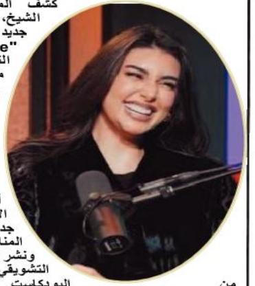
من "X"، وعلق قائلاً: بودكاست "Big Time" من الهيئة العامة للترفيه وموسم الرياض، سيكون أميز بودكاست على مستوى العالم، ترقيوا الحلقة الأولى قريباً.

أيضا علق عمرو أديب على مشاركته في هذا "البودكاست"، وكشف عن سبب موافقته على تقديمه، من خلال منشور عبر حسابه بموقع اكس: لم أتخيل أنه بعد المسيرة الطويلة في الإعلام، سيكون هناك جديد في حياتي، حتى أقنعتني أبو ناصر أن هناك شيء مختلف يمكن تقديمه، وهو ليس المستقبل ولكنه الحاضر الآن، بودكاست "big time" هو اسم على مسمى كل الكبار في زمن مواقع التواصل الاجتماعي قريباً.