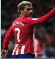
يسعى مانشستر يونايتد للحصول على خدمات الفرنسي أنطوان غريزمان، مهاجم أتلتيكو مدريد، في المركز الثاني لثلاثي الميركاتو الشتوي المقبل. ووفقا لبرنامج «الشيرنجيو» الإسباني، يريد مانشستر الحصول على توقيع غريزمان في يناير/كانون الثاني، لا سيما أن هناك شروطا جزائيا في عقده يبلغ 25 مليون يورو فقط. وأشار البرنامج الإسباني إلى أن غريزمان لا يفكر في العرض ويركز فقط على تجديد عقده مع أتلتيكو الذي ينتهي في 2026.

وأوضح أن غريزمان طلب من أتلتيكو التجديد حتى 2027، مع راتبه من 7 إلى 10 ملايين يورو. وذكر أن غريزمان رغم أنه اللاعب الأكثر حسما في أتلتيكو، لكنه لا يحصل على أعلى راتب في الفريق، ويأتي في المرتبة الثالثة بعد كوكي ويان وأوبلاك وكان غريزمان يحصل على 17 مليون يورو وكراتب سنوي ثابت مع برشلونة، كما وصل الرقم إلى 20 مليون بالآفات. وكشفت الوثيقة الإسبانية أن غريزمان سبق أيضا أن حصل على عرض سعودي مغر في الصيف الماضي، لكنه فضل البقاء مع أتلتيكو.