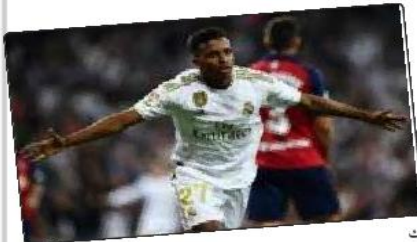
أكد رودريجو جويس، نجم ريال مدريد، أن إعائه الكامل بقرارات الإيطالي كارلو أنشيلوتي، مدرب الميرنجي، يجعله يقبل اللعب في مركز المهاجم الصريح. وقال رودريجو، في تصريحات أبرزتها صحيفة «أس» الإسبانية: «المدرّب يعلم أنني لا أحب اللعب في مركز المهاجم، لكنني أفعل ذلك من أجل الفريق ومن أجله أيضا لأني أؤمن به. إنه يدرك ذلك ولا توجد مشاكل بيننا».

وأجاب رودريجو عن سؤال: «هل قال لك أنشيلوتي شيئا، بسبب تصريح أنك لا تحب اللعب في مركز المهاجم؟»، قائلا: «في بعض الأحيان نسمح بشيء ويخرج شيء آخر. الأمر معقد قليلا» وتابع: «أنشيلوتي بالنسبة لي شخص مهم جدا. في بداية هذا الموسم عندما لم تسر الأمور على ما يرام، ساعدني دائما ولذلك أشكره». وأردف نجم البرازيلي: «لا أستطيع تحديد عدد الأهداف التي سأحرزها، كما أنني لا أتحدث عن هذا أبدا، لأنه لا يجب أن يخطئ الجيد». ولدى سؤاله «من سيحجز أهدافا أكثر فيسوس أم بيليجام؟»، رد: «لن أقول ذلك أيضا، بما أنه لا يجب أن يخطئ الجيد، فإني لا أريد أن يكون لديهم سوء حظ». ولما يتعلق بضرورة تعاقد ريال مدريد مع مبابي، قال رودريجو: «لا أعرف. يجب أن تسأل المدرب أو الرئيس حول ذلك». إلا أن الصحفي وجه له السؤال بشكل محدد «ماذا سنفعل أنت إذا كنت الرئيس». هل ستجلبه أم لا إلى ريال مدريد؟»، رد بشكل حاسم: «بالطبع سأعاقد معه. لكن الأمر لا يتعلق بمبابي فقط، إنه لاعب كبير ونريد اللعب مع أفضل اللاعبين في الفريق». وختم الصحفي بسؤال: «إذا كنت رئيسا لريال مدريد وتمكنت التعاقد مع لاعب واحد فقط، من ستوقع معه». هالاند أم مبابي؟»، رد رودريجو: «لا أعلم... إنه أمر صعب جدا».