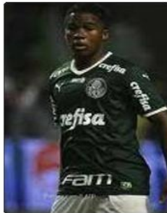
تعهد المهاجم البرازيلي إنديريك، البالغ من العمر 17 عاما، لاعب ريال مدريد المستقبلي، اليوم الإثنين «بالتفاني» لدى وصوله إلى أول معسكر له مع منتخب السامبا، الذي سيواجه كولومبيا والأرجنتين في تصفيات مونديال 2026. وقال إنديريك للصحافة الشيفزيونية التابعة للاتحاد البرازيلي لبدء وصوله إلى معسكر المنتخب: «لن يكون هناك نقص في التفاني والفرح والسعادة. أتمنى أنه أفكّر من المساهمة في ذلك». وكان مهاجم باليراس، مصدر المودي البرازيلي، من أوائل الواصلين إلى المقر الرياضي للاتحاد البرازيلي في تريسوبوليس، في المنطقة الجبلية بولاية ريو دي جانيرو.

وقال إنديريك: «أمل أن نفوز بالمبارتين لسعادة الفريق على الوصول إلى كأس العالم المقبلة». كما انضم مهاجما ريال مدريد فيسوس من جويرو ورودريجو ولاعب وسط نيو كاسل برونو جيساريس، إلى معسكر السامبا اليوم الإثنين بدأ المنتخب البرازيلي، اليوم الإثنين، معسكره في المقر الرياضي للاتحاد البرازيلي، استعدادا للمبارتين المقبلتين في تصفيات أمريكا الجنوبية المؤهلة لكأس العالم 2026 وتحل البرازيل، صاحبة المركز الثالث في الترتيب برصيد 7 نقاط، ضيفة على كولومبيا صاحبة المركز الخامس 6 نقاط يوم الخميس المقبل. وفي المباراة التالية، يوم 21 نوفمبر/نشرين الثاني سيحوض منتخب السامبا كلاسيكو أمريكا الجنوبية ضد الأرجنتين، مصدرة التصفيات برصيد 12 نقطة، على ملعب ماراكانا في ريو دي جانيرو. وكان ريال مدريد قد تعاقد مع إنديريك، الصيف الماضي، من خلال صفقة بلغت 60 مليون يورو شاملة التغيرات، على أن يصل اللاعب في منتصف يوليو/تموز 2024، عندما يبلغ من العمر 18 عاما.