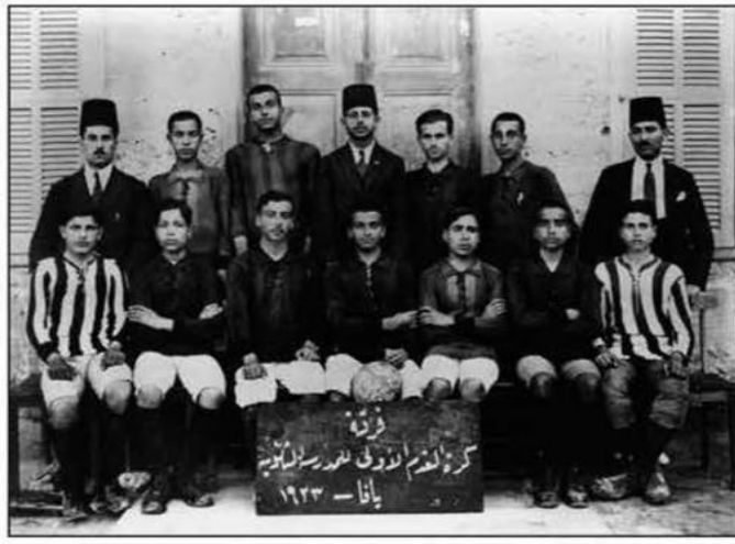
الماضي بمشاركة الجنود والضباط البريطانيين وحسب عام 1948. وكان هدف النادي الذي أسسه مجموعة من الشباب العرب وبعض الوجود الأجنبية العاملة في المدينة إحياء الألعاب الرياضية التي

الوزارة وأقرته: إن حكومة صاحب الجلالة تنظر بعين العطف إلى تأسيس وطن قومي للشعب اليهودي في فلسطين، وستبذل غاية جهدها لتسهيل تحقيق هذه الغاية، على أن يكون مفهوماً بشكل واضح أنه لن يوتي بعمل من شأنه أن ينتقص الحقوق المدنية والدينية التي تتمتع بها الطوائف غير اليهودية المقيمة الآن في فلسطين، ولا الحقوق أو الوضع السياسي الذي يتمتع به اليهود في البلدان الأخرى. وسلكون ممثلاً إذا ما أحطمت اتحاد الهيئات الصهيونية علماً بهذا التصريح». وبعد عد بلفور شهدت فلسطين زيادة مطردة في تأسيس الأندية والجمعيات الخيرية والكشافية والنسائية، وبات تأسيسها مطلباً وطنياً ملخاً من أجل الرد على الخطر الصهيوني ووجود الانتداب البريطاني في فلسطين، فكان نشاط الأندية في تلك الفترة بأخذ طابعاً وطنياً اجتماعياً، وكان حضورها مؤسسات اجتماعية سياسية يمكن سعي الفئات المثقفة للتعبير عن حسها الوطني المعادي للاحتلال والصهيونية، وفيما بعد بدأ ينز الطابع الرياضي بالإضافة إلى الاجتماعي والثقافي.