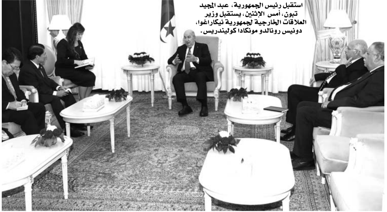
استقبل رئيس الجمهورية، عبد المجيد تبون، أمس الإثنين، يستقبل وزير العلاقات الخارجية لجمهورية نيكاراغوا، دونيس رونالدو مونكادا كوليندريس.

الرازح تحت الاحتلال، ولتؤكد مجدداً أنه لا مناص من تمكين هذا الشعب الأبي من تكريس حقوقه الوطنية المشروعة عبر إقامة دولته المستقلة، وعاصمتها القدس الشريف.