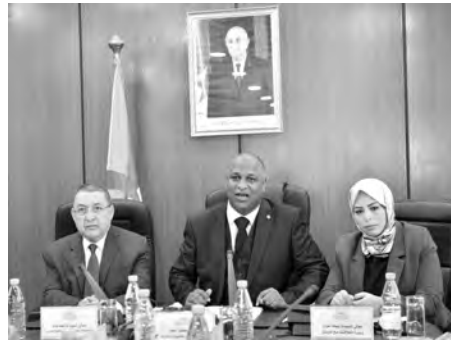
بعد وقوع الكوارث بمعدل لا يقل عن 35 ملياد دينار سنويا، أبرز الوزير أن "التجارب السابقة أكدت وجود نقاط ضعف ونقص في الإطار القانوني، البيوتكنولوجية". ويعد أن ذكر بأن الجزائر سجلت في السنوات الأخيرة "تعدد الكوارث نتج عنها مبالغ مالية هامة دفعت في التدخل

ناصر ح. لاسيما اقتصاد المصالحة على التكفل بأنظارها، في حين أن الأمر يستلزم، حسب، إدراج الوقاية والتنبؤ كمحورين أساسيين. ويسمح النص الجديد بالانتقال من تسيير الكوارث إلى الوقاية والتدخل والحد من أخطارها، فضلا عن إدراج التسيير التشاركي للأخطار وإيلاء العناية للاستثمار في الوقاية والتنبؤ مع إدراج التكنولوجيات الحديثة والرقيقة. كما تضمن نفس المشروع إدراج "مرحلة نهائية تخصص للتعاقد والاستشفاء بعد الكارثة وإعادة التأهيل والإعمار". إلى جانب تعزيز الوعي العام وتربية الحس المدني في مجال التعامل مع الكوارث، وكذا مراجعة نظام التأمين ضد الكوارث يجعله أكثر جاذبية عند الاكتتاب ومرونة عند التعويض.