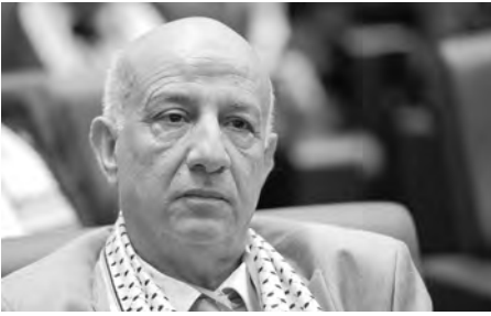
ت. ياسين أ.

يقيم فيها مندوبون الذين تجاوز عددهم 3000 مندوب ابتداء من ساعة متأخرة من الليل وتواصل حتى فجر أمس، وشهدت عملية الاقتراع الخاصة ببعض الولايات مشاهدات دفعتم الشرفيين لتأخيرها بعض الوقت، ما أدى إلى تأخر عملية الإعلان عن النتائج، وتم توزيع مقاعد اللجنة المركزية التي بلغت 351 عضو منهم ثلثان عبر الانتخاب على الولايات مع اشتراطات تمثل الشباب والمرأة بمقدار لكل فئة على الأقل، واشترطت حيازة العضو المنتخب على شهادة جماعية كما أكده مندوبين الذين حضروا العملية. علما أن القانون الأساسي للحزب الذي تمت المصادقة عليه في المؤتمر يعطي صلاحية اختيار الثلث الباقى من أعضاء اللجنة المركزية للأمين العام المنتخب، وصادق المندوبون، صبيحة أمس، على لائحة السياسة العامة للحزب التي أكدت التزامه بمبادئ الجمهورية والنضال لمواصلة مسيرة البناء، والتمسك بمبادئ وقيم أول نوفمبر للحفاظ على المكاسب المحققة والتمسك بالطابع الاجتماعي للدولة. كما ركزت اللائحة على أهمية مواصلة الجهود وتوحيد صفوف الحزب للحفاظ على ريادته في الساحة السياسية، والتصديق لكل المؤامرات التي تحاك ضده، مؤكدا أن الحزب تخطى مرحلة جد صعبة في حياته السياسية وتمكن من الحفاظ على مكانته بالصدى للجهات التي كانت ترغب في إدخاله للتمتحن.