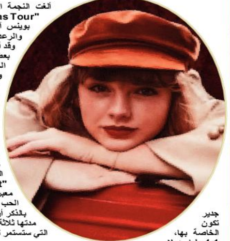
جدير تكون الخاصة بها، 4.1 مليار دولار.

صوّر فيلم تايلور خلال جولة موسيقية لها، وحقق إيرادات قياسية تتخطى الـ 125 مليون دولار، بعد أن تصدر شباهك التذاكر في أميركا الشمالية. وائلش التقرير الصحفي الذي نشرته مجلة "بلمبيرج نيوز"، أن سويفت أصبحت رسمياً مليارديرة، بعد وصول ثروتها الصافية إلى 1.1 مليار دولار.