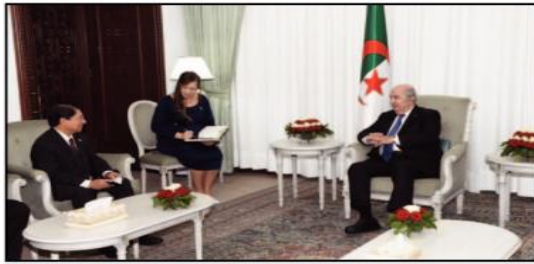
في تصريح لعطاف

استقبل رئيس الجمهورية، السيد عبد المجيد تبون، أمس الإثنين، وزير العلاقات الخارجية لجمهورية نيكاراغوا، السيد دونيس رونالدو مونكادا كوليندريس.