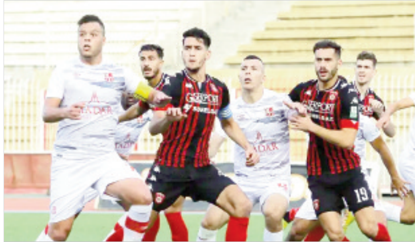
في حين يأمل "البايك" من خلال التغلب على الشباب، إلى الارتقاء إلى الصدارة وإزاحة مولودية الجزائر التي تحتل الصف الأول مؤقتا. وبملعب 8 ماي 45 بسطيف، يلتقي الضريقان المنتشيان بالفوز ويتعلق الأمر بالوفاق المحلي وضيئه اتحاد الجزائر في الأنتصارات في اسرع وقت ممكن.

الضريقان اللذان يحتلان نفس المركز، يطمحان الى الفوز بغية الاقتراب من كوكبة المتقدمة، بقيادة مدربين مخضرمين، أحدهما الفرنسي فرانك دوما (وفاق سطيف) والآخر الأسباني خوان كارلوس غاريدو، بغض النظر عن أفضلية اللاعب بالنسبة للوفاق.